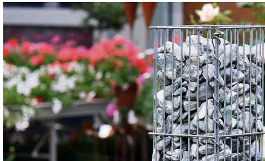
Ein einzelner Steinkorb kann auch mal als Dekomittel eingesetzt werden.