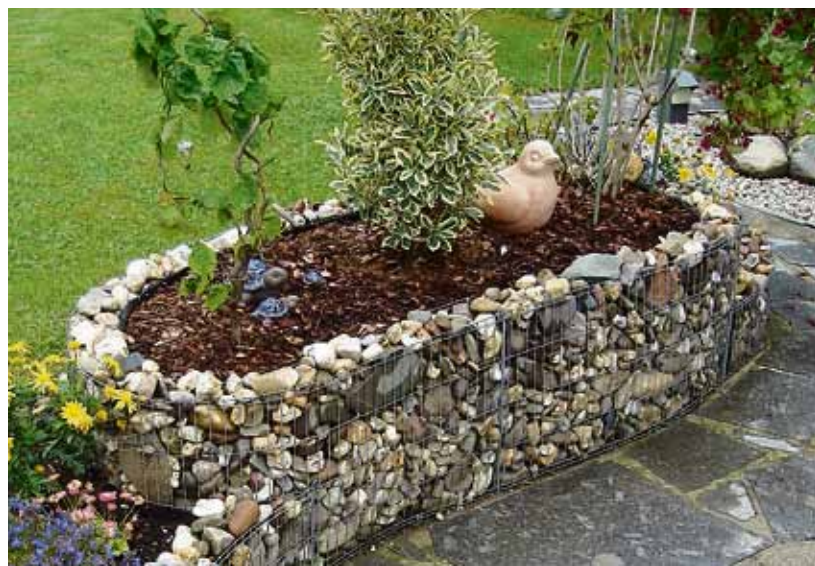
Der Steinkorb dient als schöne Umrandung für verschiedene Pflanzen.

*Das Bacher Gartencenter bietet unter anderem eine grosse Auswahl an Kräutern und Pflanzen an. Zudem die passenden Gefässe für Balkon und Terrasse. Weitere Informationen gibt es bei: www.bacher-gartencenter.ch .