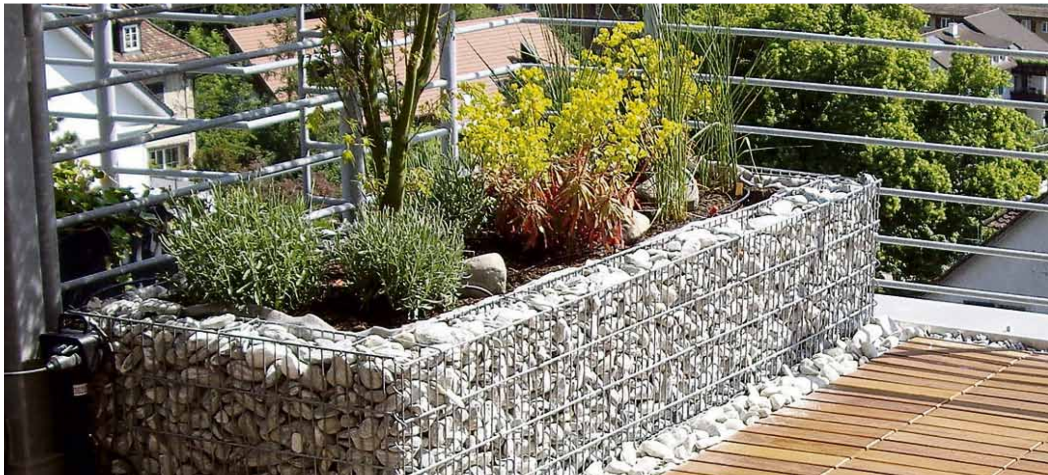
Steinkörbe kann man nicht nur im Garten, sondern auch auf einer Terrasse einsetzen, wie dieses gelungene Beispiel zeigt.