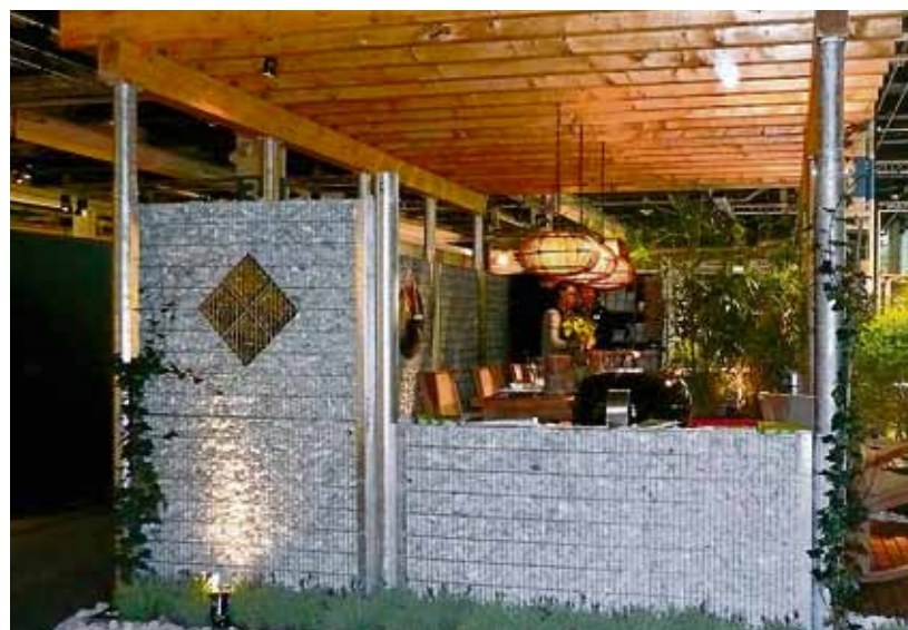
Die Gabionen eignen sich auch als Sichtschutzwände für den Garten.