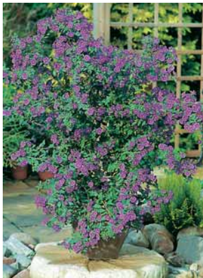
Blauer Nachtschatten (Lycianthes)